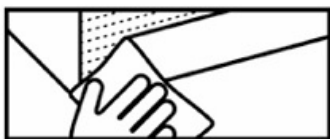
Схема монтажа дверной щетки на клеевой основе

В месте крепления профиля очистите поверхность дверного полотна от загрязнений и пыли для максимальной степени адгезии.